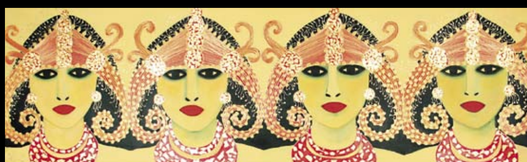
Head Affairs I & II, oplage 125 stuks, zeefdruk op geschept papier. Verkrijgbaar bij ART4U kunstuitleen.