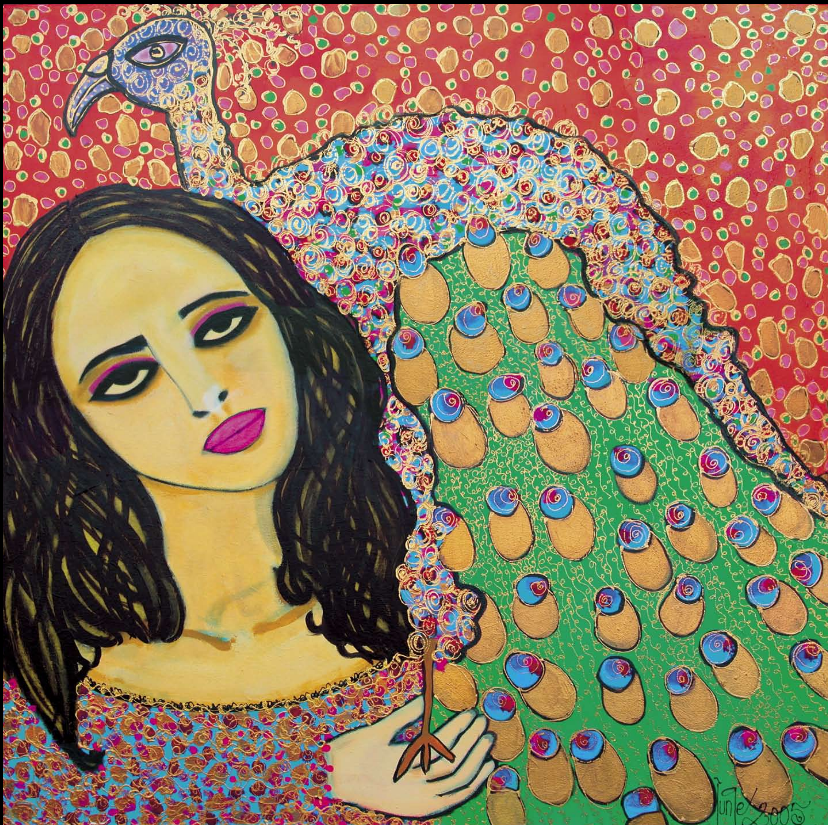
Acryl op doek, 80x80 cm, titel: „My Peacock“