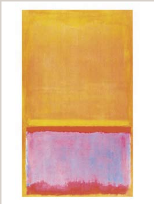
Mark Rothko, Untitled

De abstracte werken van Mark Rothko spreken nog altijd een groot publiek aan, zo merken we bij kunstuitleen ART4U. De reproducties van deze icon van de moderne kunst worden veel gevraagd. In de vijftig jaar dat hij actief was, creëerde Rothko een nieuwe abstracte schilderijstijl waarin hij bijzonder veel aandacht besteedde aan kleur, diepte, vorm en compositie.